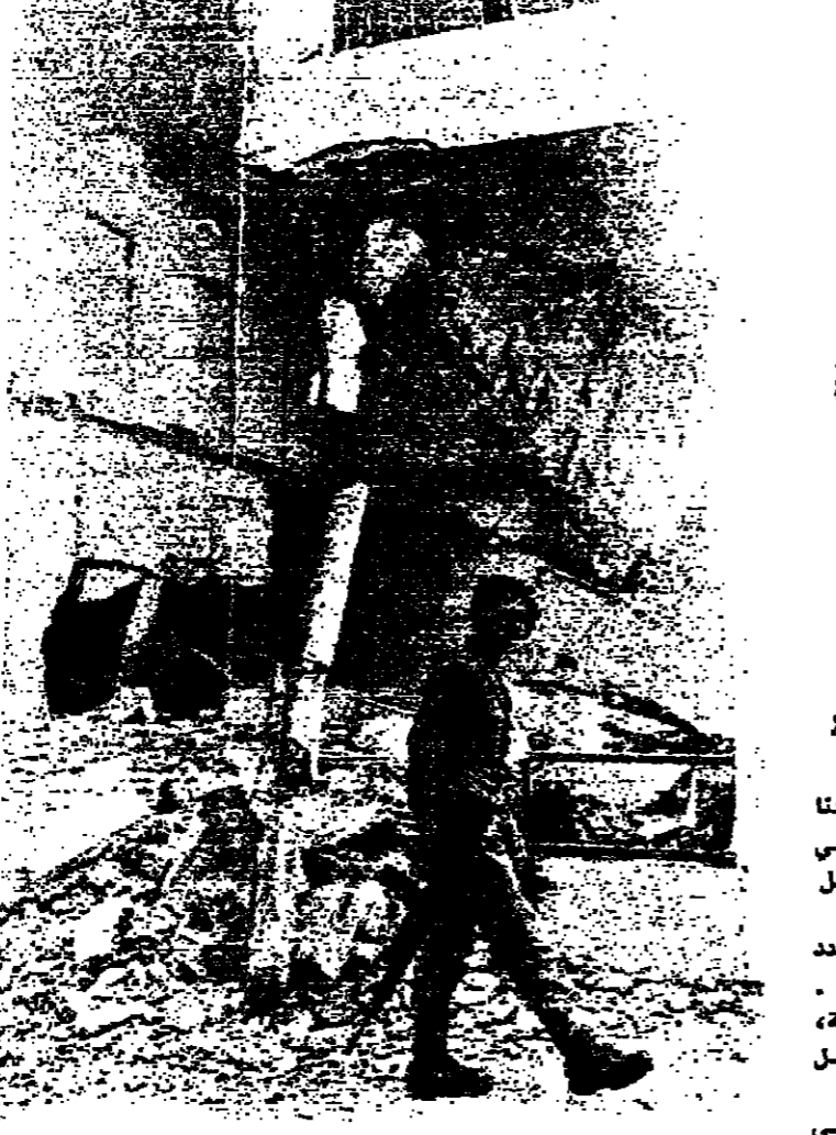
دركي امام منزل حيمته الفذائفي الكوئنة

يرجى من المتبارين الحضور السليم في شركة تلفزيون لبنان والمشرق في الحادية يوم الخميس ٥ حزيران الساعة السادسة تماماً للاشتراك بالمباريات.